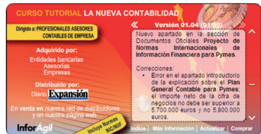
Animación Flash, con zona interactiva de información, sobre uno de los productos de InforAgil