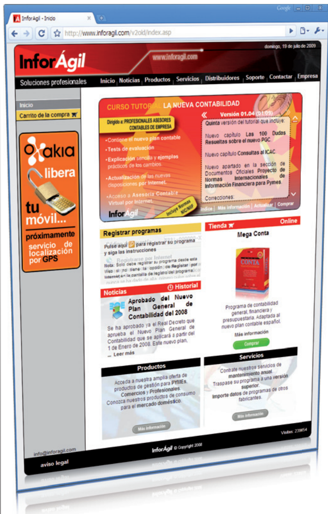
Diseño y programación de la página web www.inforagil.com .

Trabajando como ingeniero informático en InforAgil, he desarrollado bastantes tareas de diseño, relacionadas siempre con el sector al que se dedica la empresa, el desarrollo de programas de gestión de consumo. Las tareas se pueden resumir en, diseño de páginas web (incluyendo banners y animaciones flash), diseño de imaginería de los programas (iconos, botones, pantallas de splash), diseño de folletos publicitarios y explicativos, trípticos y tarjetas de visita. Estos son algunos ejemplos.