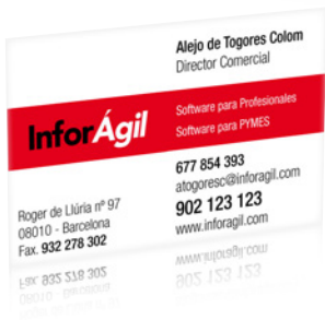
Tarjetas de visita de InforAgil.