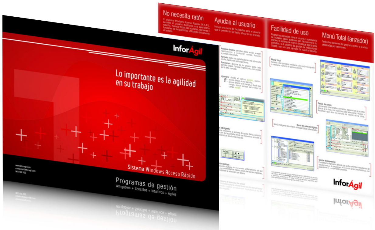
Díptico A3 sobre el interface de los productos de InforAgil.