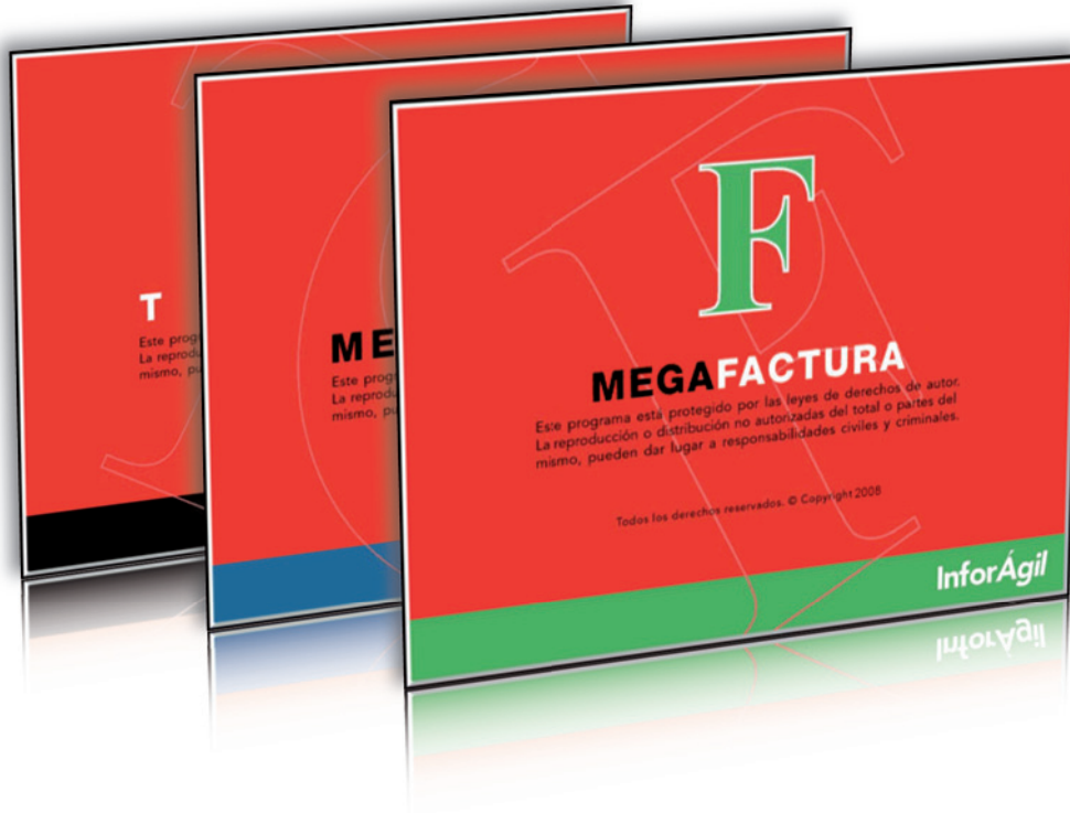
Pantallas de Splash (inicio) e iconos de aplicaciones.

Diseño de la imagineria de las aplicaciones de InforÁgil.